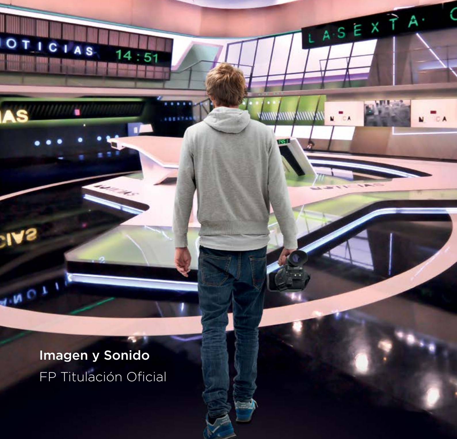
Imagen y Sonido FP Titulación Oficial

CREA TU FUTURO PROFESIONAL CON LAS MEJORES EMPRESAS