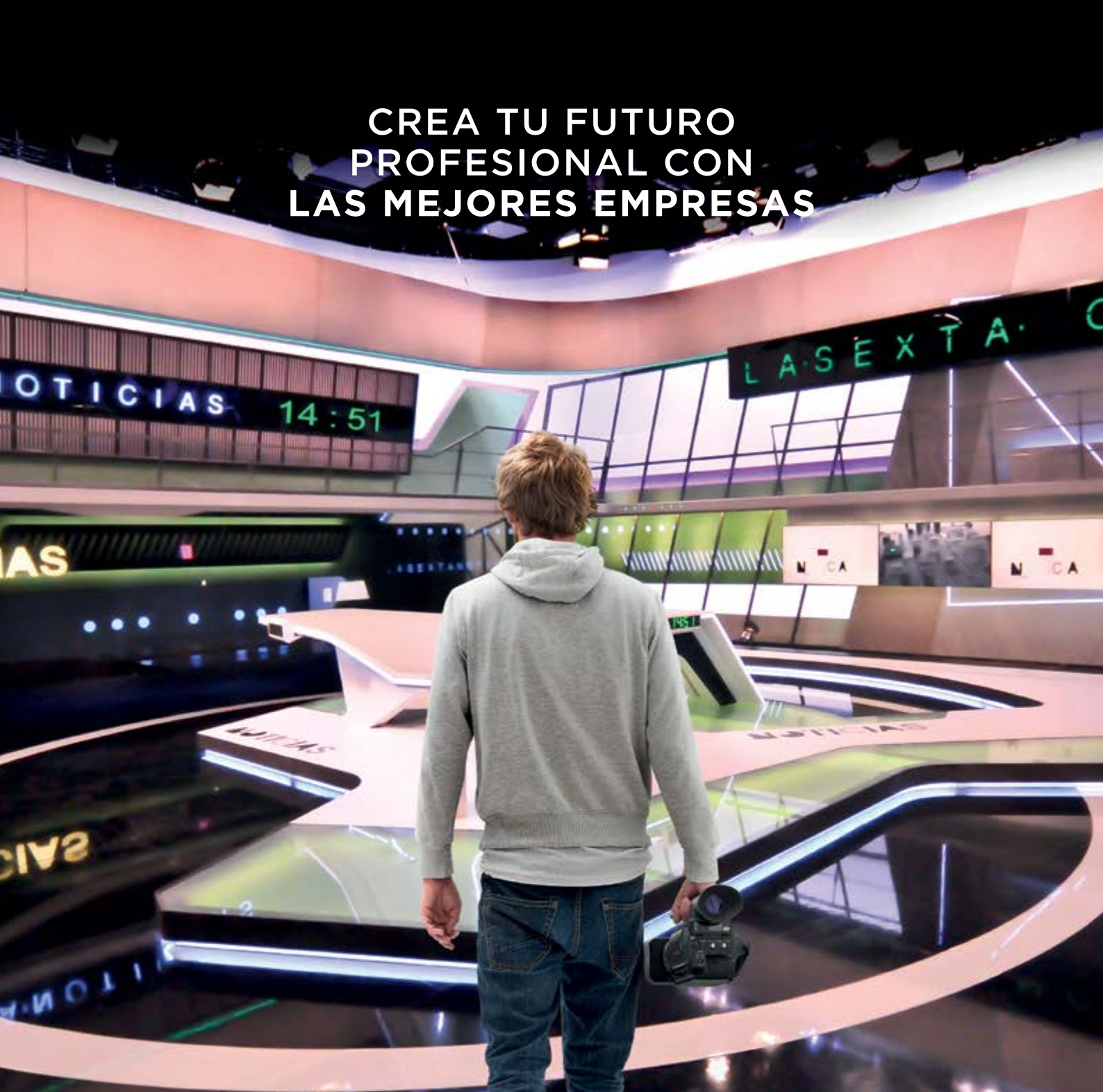
Imagen y Sonido FP Titulación Oficial

CREA TU FUTURO PROFESIONAL CON LAS MEJORES EMPRESAS